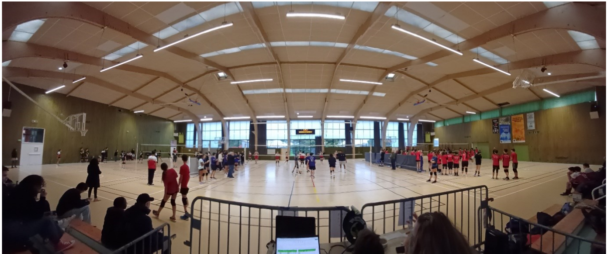
Figure 1: Espace Sportif Pierre de Coubertin – CORNEBARRIEU